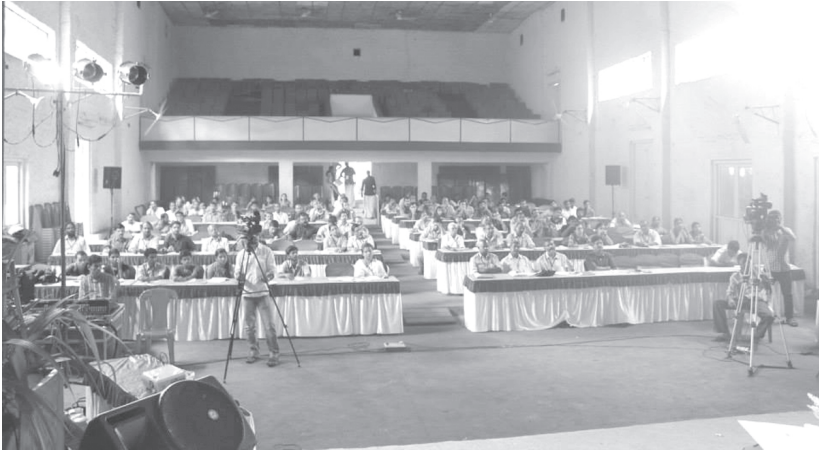
അഭയം 2014 ന്റെ സദസ്സ്

ബി.ജെ.പി. ഭരിക്കുവാനുള്ള ഭൂരിപക്ഷം ഒറ്റക്ക് നേടിയത് എങ്ങനെയാണെന്നും നാം പരിശോധിക്കേണ്ടതുണ്ട്. ഇന്ത്യ ഇൻകോർപ്പറേറ്റ്സ് (India Incorporates) എന്ന് മാധ്യമങ്ങൾ വിശേഷിപ്പിക്കുന്ന ഇന്ത്യയിലെ കൂത്തക കമ്പനികളുടെ അറിവോടും ആശീർവാദത്തോടും കൂടിയാണ് അവർ തിരഞ്ഞെടുപ്പിനെ നേരിട്ടത്. ഇതിൽ ശ്രദ്ധേയമായ ഒരു വസ്തുത ഒളിഞ്ഞുകിടപ്പുണ്ട്. ഇന്ത്യ ഇൻകോർപ്പറേറ്റ്സ് ബി. ജെ. പി. ക്ക് അനുകൂലമായ നിലപാട് കൈക്കൊണ്ടപ്പോൾ ഇതുവരെ ഇന്ത്യൻ രാഷ്ട്രീയത്തിൽ സ്വീകരിച്ച നയസമീപനങ്ങളിൽ നിന്നും അവർ വ്യതിചലിക്കുകയാണ് ഉണ്ടായത്.