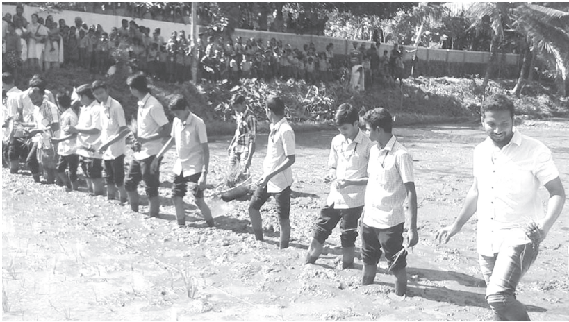
കാനം പാടത്ത് ഞാറു നടുന്ന വിദ്യാർത്ഥികൾ