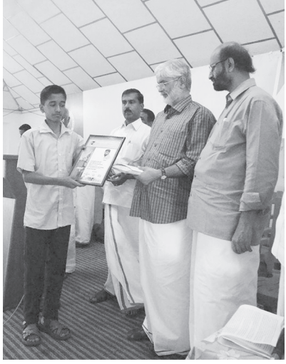
ലൈബ്രറി കൗൺസിൽ അവാർഡു ദാനം